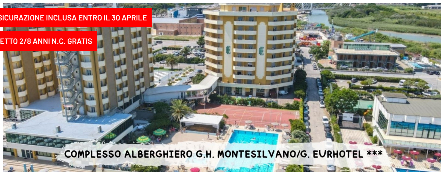
COMPLESSO ALBERGHIERO G.H. MONTESILVANO/G. EURHOTEL ***

quote a persona in pensione completa bevande incluse