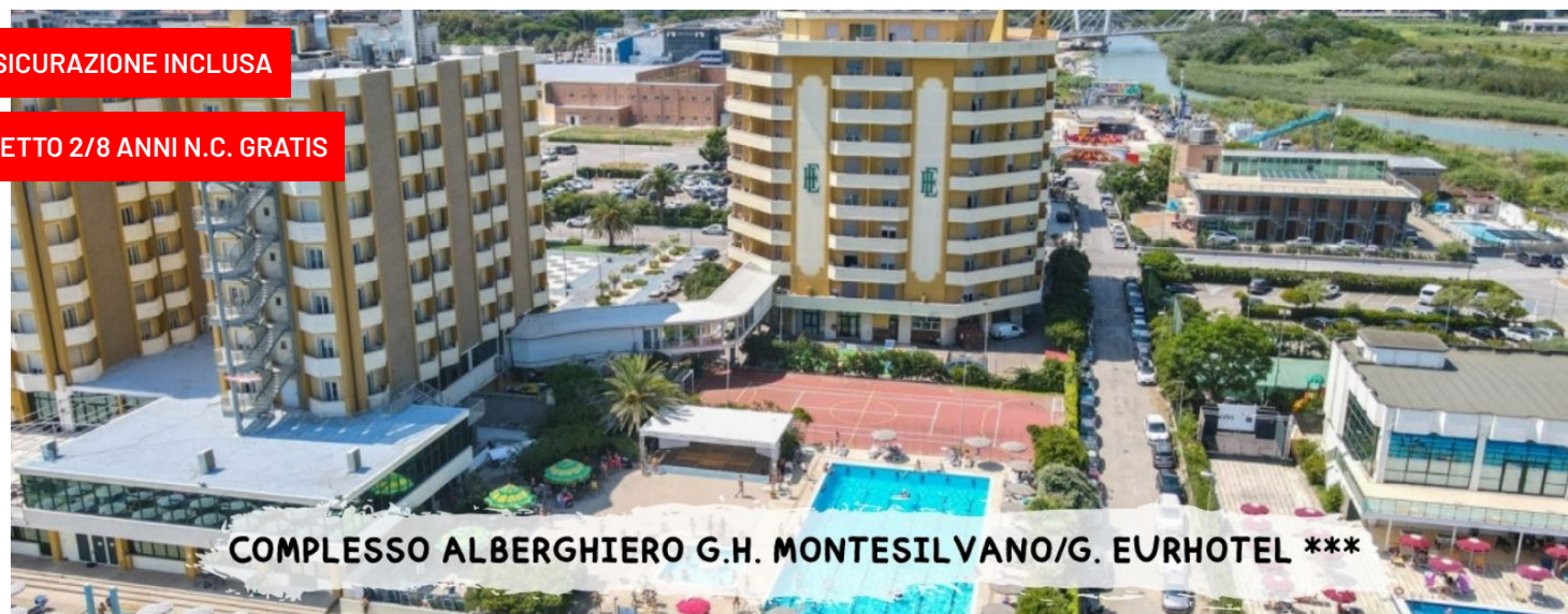
COMPLESSO ALBERGHIERO G.H. MONTESILVANO/G. EURHOTEL ***