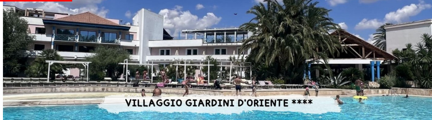
VILLAGGIO GIARDINI D'ORIENTE ****

pensione completa bevande incluse quote a persona in standard