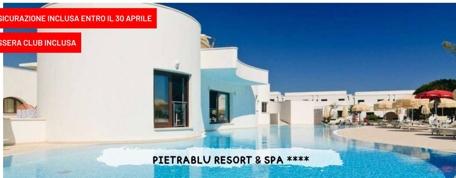
PIETRABLU RESORT & SPA ****