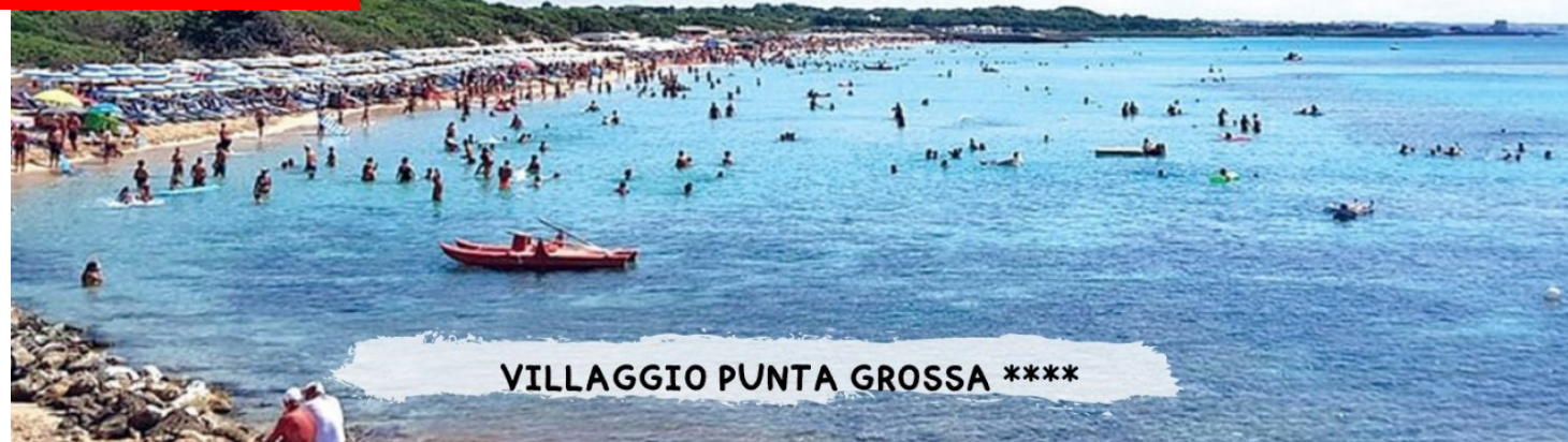
VILLAGGIO PUNTA GROSSA ****

Quote a persona in pensione completa - bevande incluse