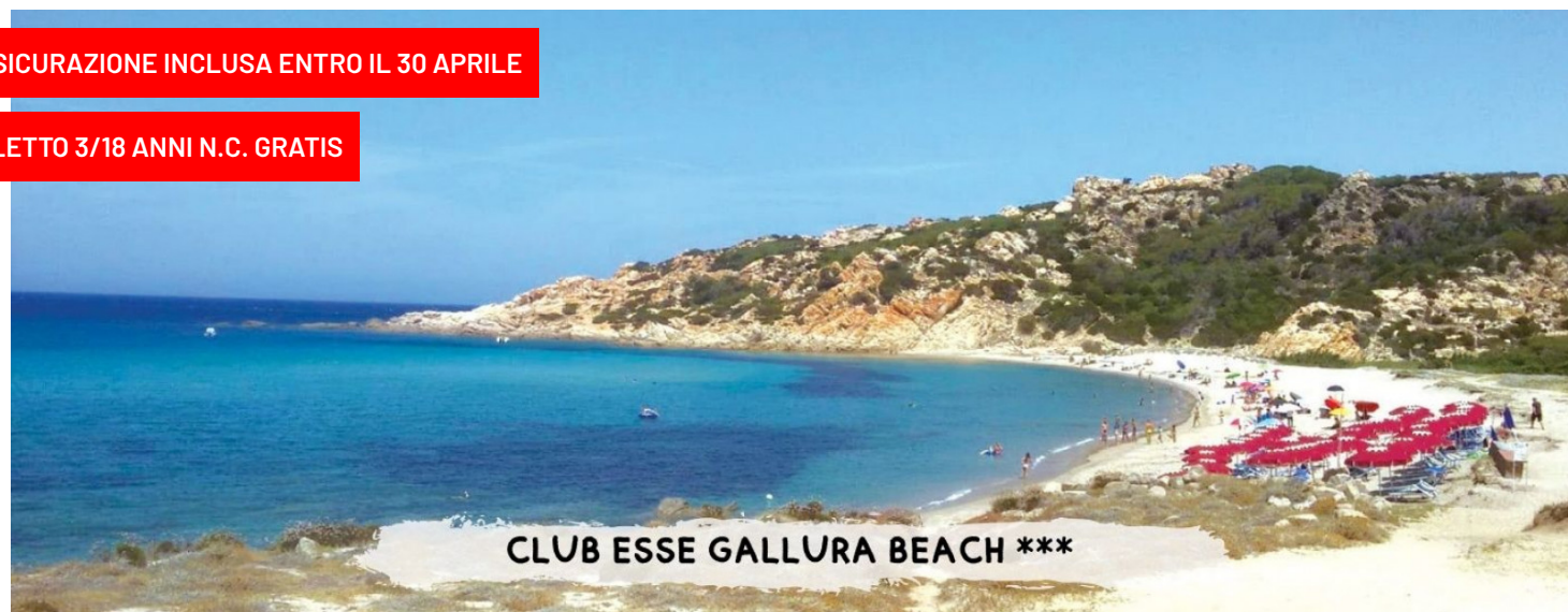
CLUB ESSE GALLURA BEACH ***