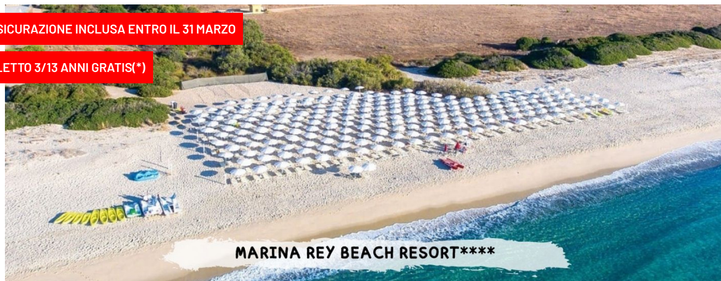
MARINA REY BEACH RESORT****

PER LE TUE SETTIMANE SPECIALI CLICCA QUI