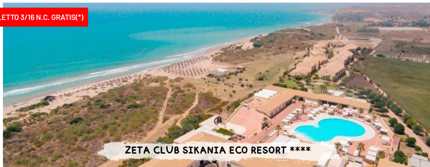
ZETA CLUB SIKANIA ECO RESORT ****

Quote a persona in doppia classic soggiorno 7 notti –trattamento di pensione completa con bevande ai pasti.