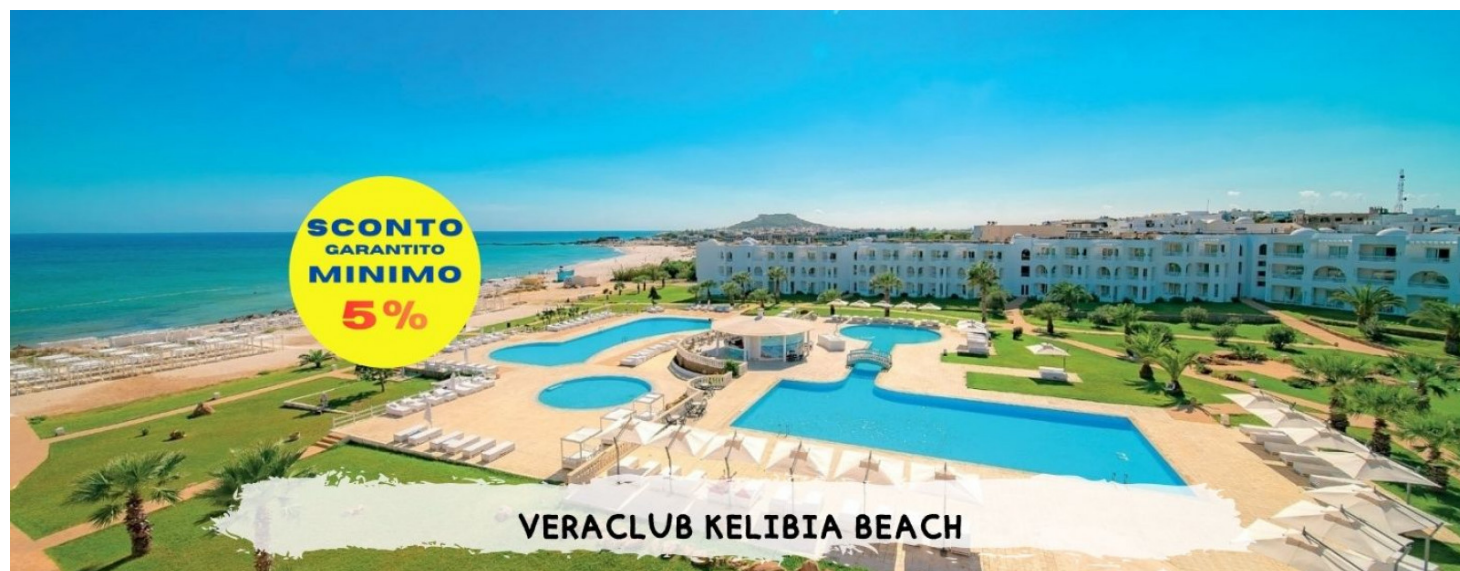
VERACLUB KELIBIA BEACH